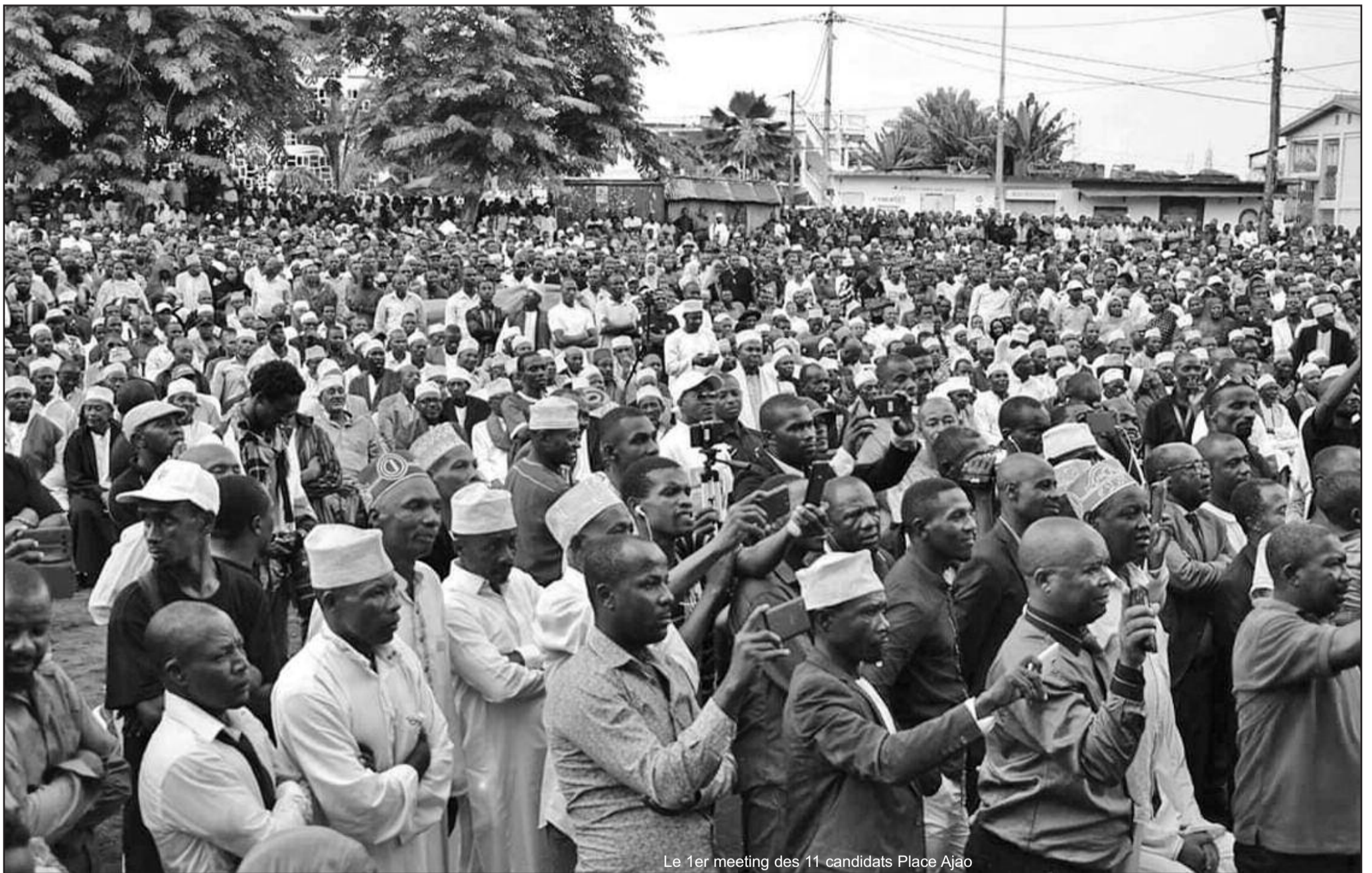
Le 1er meeting des 11 candidats Place Ajao