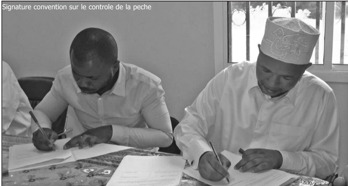
Signature convention sur le controle de la peche

propreté de poissons dans les différents points de vente et organiser les contrôles officiels de manière transparente et indépendante et mettre en place un planning d'inspection, préalablement validé par l'Office National de Contrôle Qualité et Certification de Produits Halieutiques (ONCQCPH).