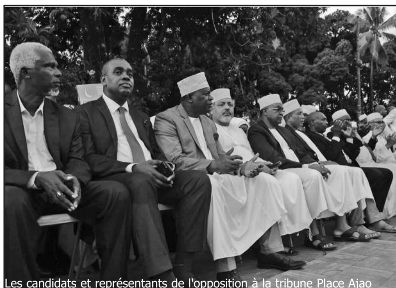
Les candidats et représentants de l'opposition à la tribune Place Ajao